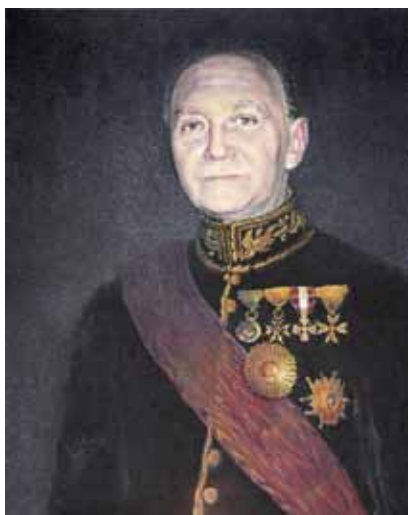
Embajador Gonzalo N. de Arámburu

Benefactores de la Academia Diplomática: