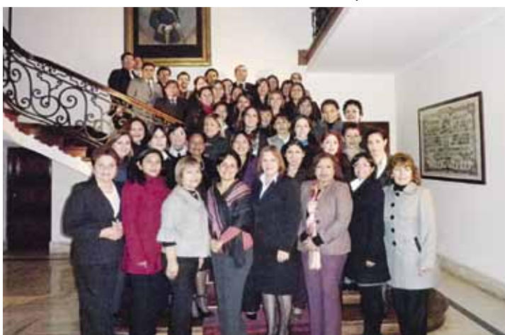
Segundo Curso de Protocolo