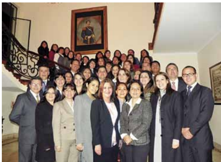
Primer Curso de Protocolo