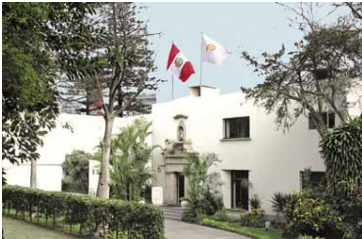
Academia Diplomática del Perú Javier Pérez de Cuéllar