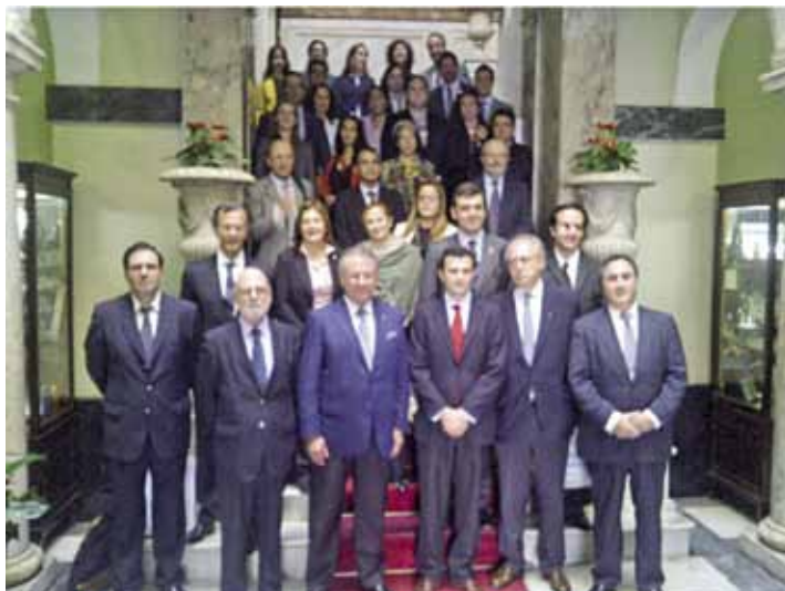
Décima Reunión de la Asociación de Academias, Escuelas e Institutos Diplomáticos Iberoamericanos Cádiz, España