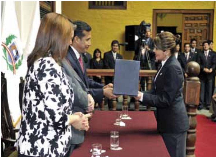
El Presidente Ollanta Humala entrega el Premio otorgado a la graduanda Olga Lukashevich Pérez, primer puesto de su promoción.