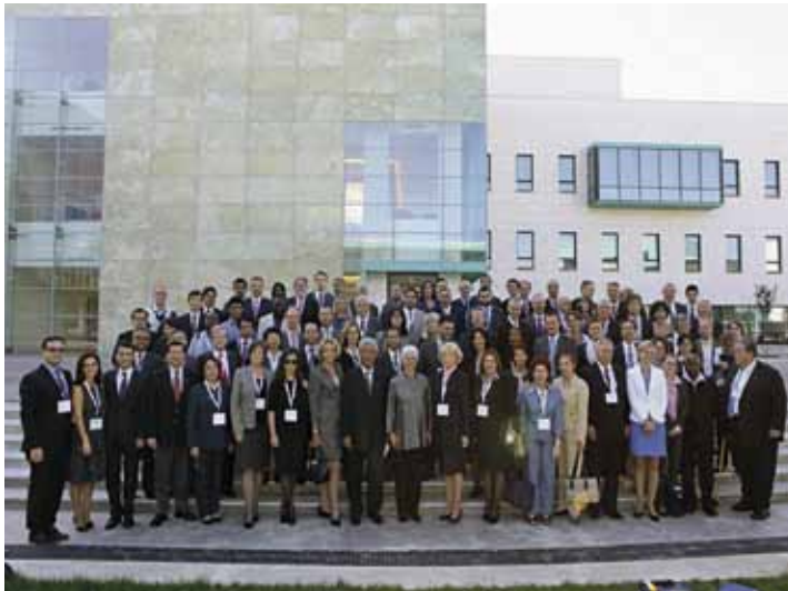
Cuadragésima Reunión de Academias Diplomáticas e Institutos de Relaciones Exteriores del mundo Bakú, Azerbaiyán