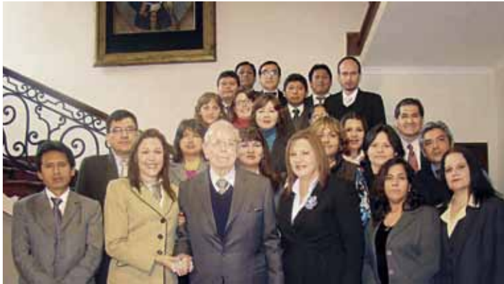
Planta administrativa de la Academia Diplomática