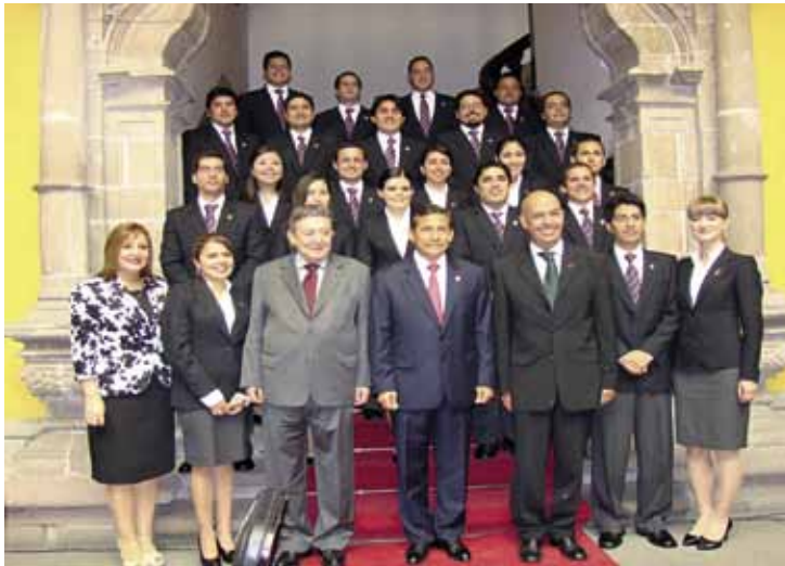
Promoción "General Edgardo Mercado Jarrín" 2012