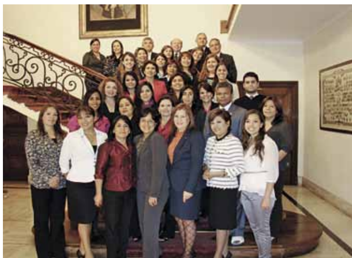
Tercer Curso de Protocolo