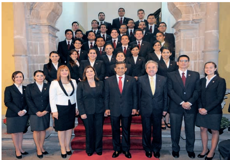
Promoción "Antonio Belaunde Moreyra"