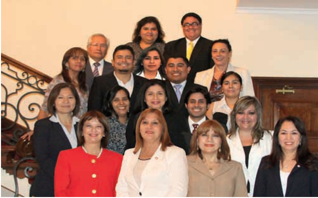
Diplomado en Cooperación Internacional