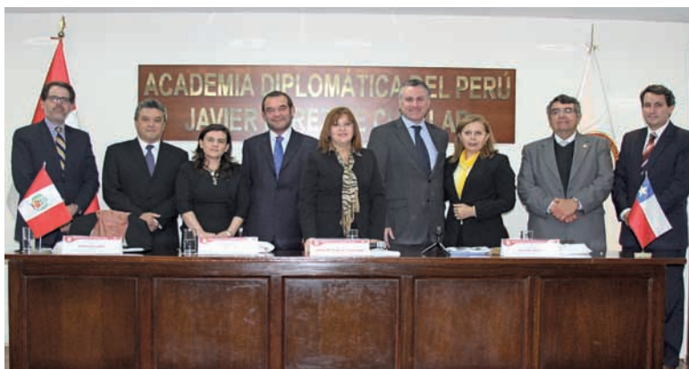
Cátedra Conjunta de las Academias Diplomáticas del Perú y Chile