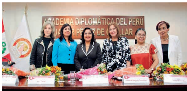
Simposio por el "Día de la Mujer"