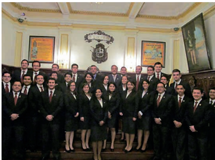
Alumnos de Segundo Año en las instalaciones del Gobierno Regional de Ica

Tal como los estudiantes de primer año lo hicieron en Cuzco, en Ica los de segundo se reunieron con jóvenes universitarios, para proporcionarles información sobre la Academia y el servicio diplomático del Perú.