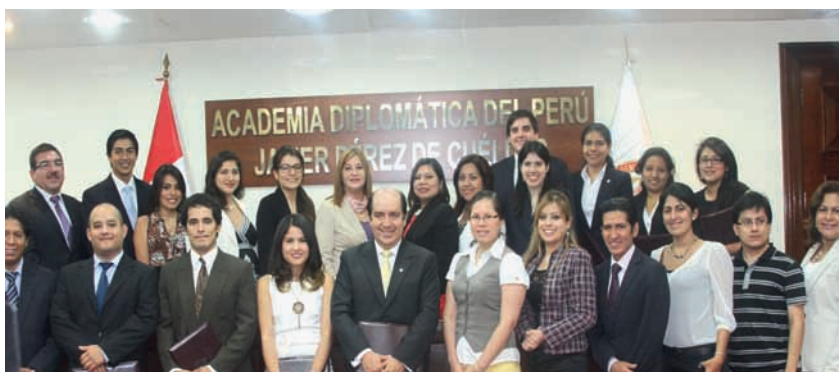
Diplomado sobre Relaciones Internacionales