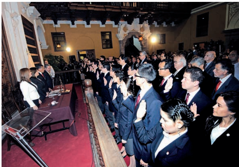
Juramentación de la Promoción "Antonio Belaunde Moreyra"