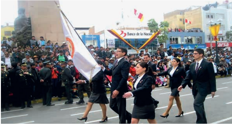
Aniversario de la Reincorporación de Tacna al Perú