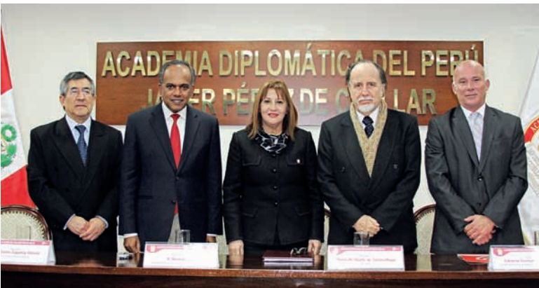
Conferencia del Ministro de Relaciones Exteriores de Singapur, Dr. Kasiviswanathan Shanmugam