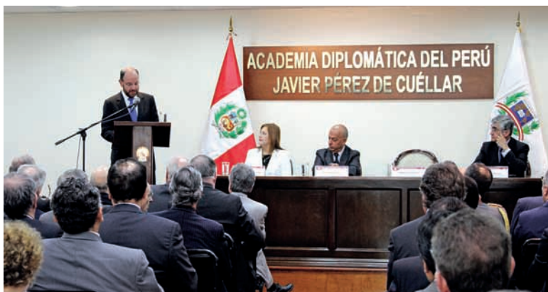
Conferencia del Canciller de Chile, Ing. Alfredo Moreno Charme