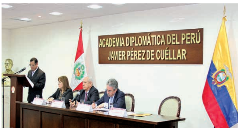
Conmemoración Acuerdo de Paz Perú-Ecuador