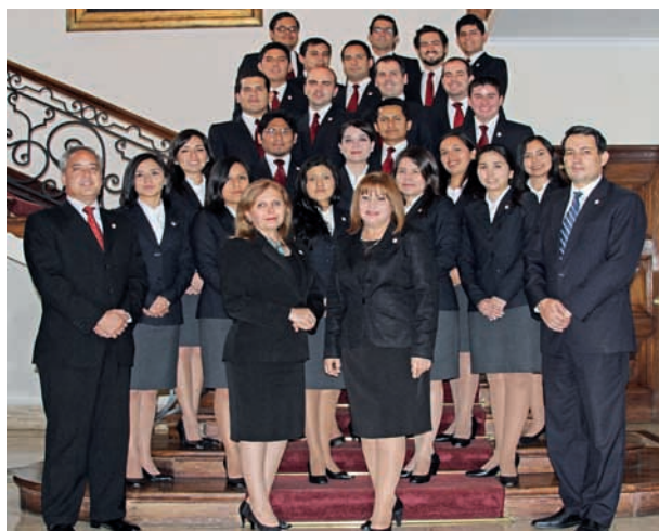
Alumnos de Primer Año y planta orgánica