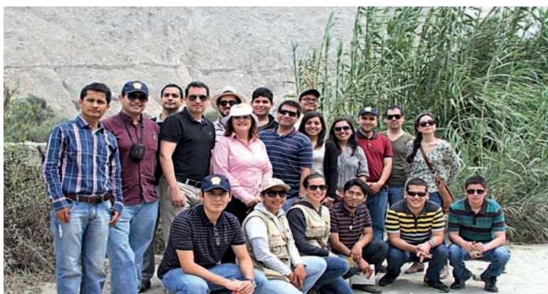
Recorrido Qhapaq Ñam entre Cieneguilla y Pachacamac