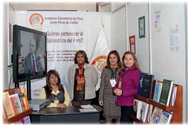
Stand de la Academia Diplomática del Perú en la Feria Internacional del libro

Para obtener información actualizada sobre la Academia, sus actividades, currícula, programas, alocuciones, se puede acceder a su portal, en esta dirección en la Internet: www.adp.edu.pe