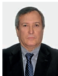
Emb. Guido Loayza Devescovi Promoción Económica-Comercial