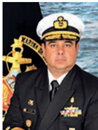
Almirante Santiago Llop Gestión de Crisis