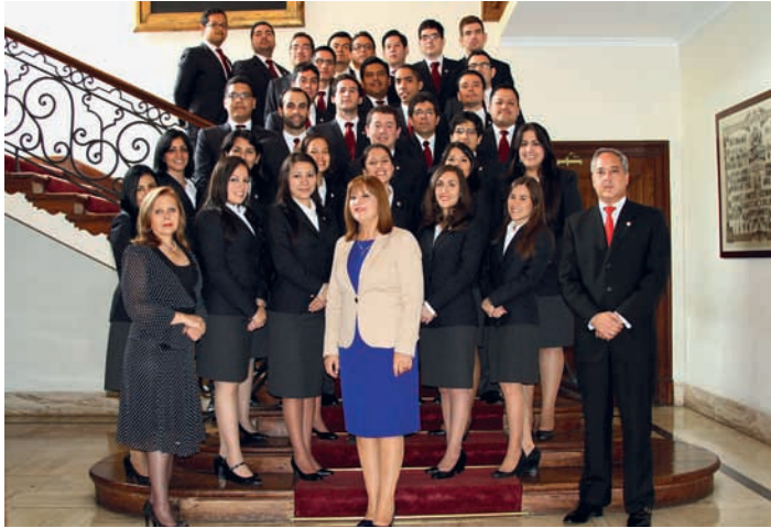
Alumnos de Segundo Año y planta orgánica