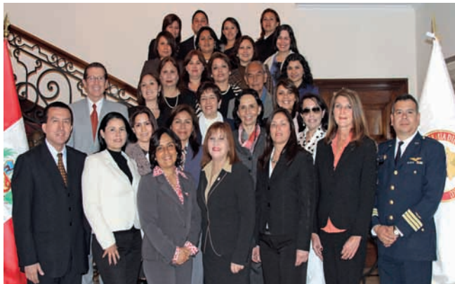
Segundo Curso de Protocolo 2013

CENEPRED Superintendencia Valores Presidencia Consejo Ministros MRE Congreso MEF Tribunal Constitucional FAP San Juan Proyectos CORPAC Concytec Turismo MEF Shandock del Perú Universidad de Piura CENEPRED Policía Militar MRE Turismo Fiscalía Ambiental Universidad San Martín Porres CENEPRED Embajada de Marruecos MRE ADP MRE Congreso Privado Embajada de Palestina Abogada