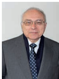
Emb. Carlos Chichizola Guimet Democracia y Derechos Humanos