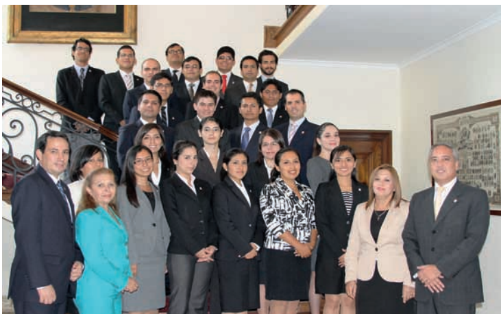
Alumnos del Primer Año de Estudios en la sección aspirantes Academia Diplomática del Perú 2013

El 4 de abril los nuevos alumnos fueron recibidos por la planta orgánica de la Academia. El 8 del mismo mes empezaron las clases 2013 y las reiniciaron los flamantes estudiantes del segundo año de la maestría.