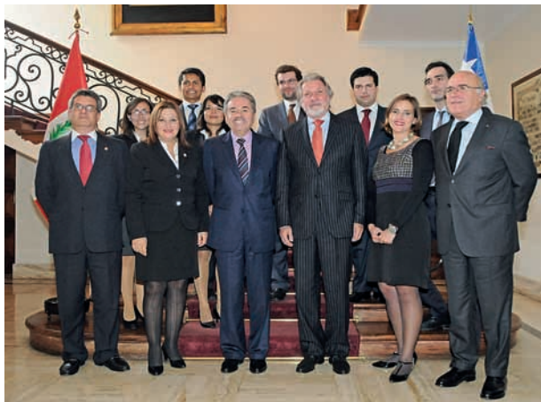
Primer Encuentro de Academias Diplomáticas del Perú y Chile Lima, 8 y 9 de mayo de 2013