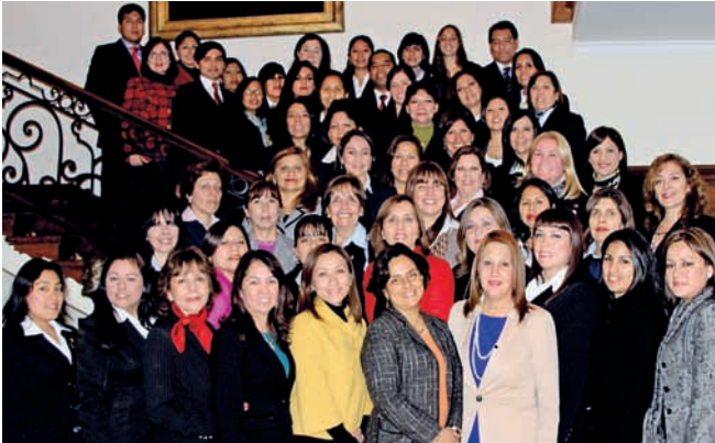
Primer Curso de Protocolo 2013