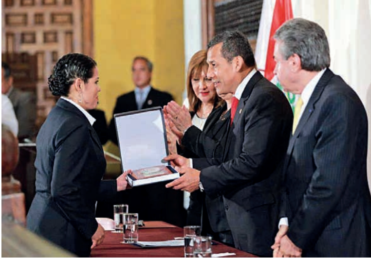
El Presidente Ollanta Humala entrega el Premio otorgado a la graduanda Aída García Maguiña, primer puesto de su promoción.