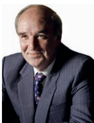
Emb. José A. García Belaunde