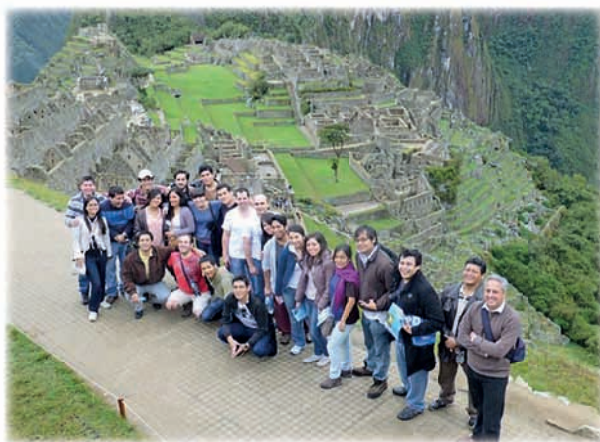
Alumnos de Primer Año en el Santuario Histórico de Machu Picchu

Asimismo, durante su estada en Cuzco, los alumnos de primer año tomaron contacto con universitarios de la región, a quienes explicaron aspectos concernientes para el ingreso a la Academia Diplomática y su funcionamiento, así como acerca del servicio exterior de la república.