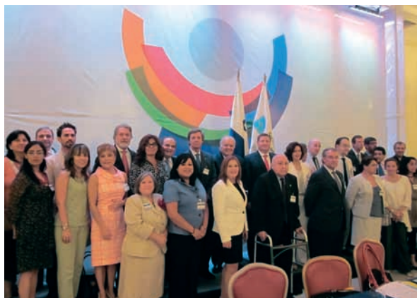
Seminario Iberoamericano sobre Diplomacia Cultural Panamá, 11 y 12 abril 2013

En 2012 se había efectuado una reunión similar en Cádiz, en la que también participó con una ponencia la Directora de la Academia Diplomática del Perú.