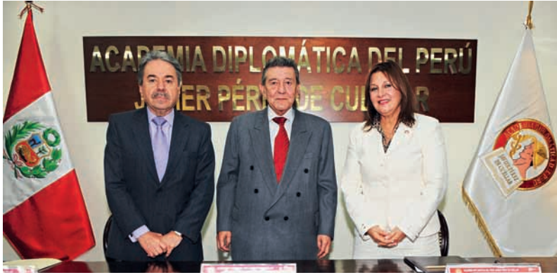
Clase Magistral del Canciller Rafael Roncagliolo Orbegoso 29 de abril de 2013