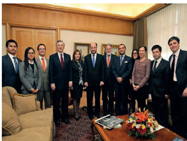
Segundo Encuentro de Academias Diplomáticas del Perú y Chile Santiago, 24 y 25 de junio de 2013