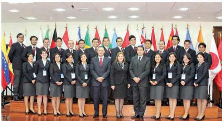
Alumnos de primer año en el Segundo Modelo de Naciones Unidas

luego discutir el proyecto de resolución presentado por el delegado de Costa Rica. Dentro del plenario simulado se pudo apreciar un debate intenso y una activa negociación entre los delegados, quienes además supieron utilizar cada una de las herramientas que brinda el Reglamento de la Asamblea General de Naciones Unidas. Ello, con la finalidad de alcanzar consensos sobre la situación actual del problema y las medidas que se adoptarían para mitigarlo.