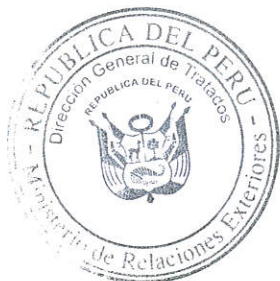
Jorge A. Raffo Carbajal Embajador Director General de Tratados Ministerio de Relaciones Exteriores