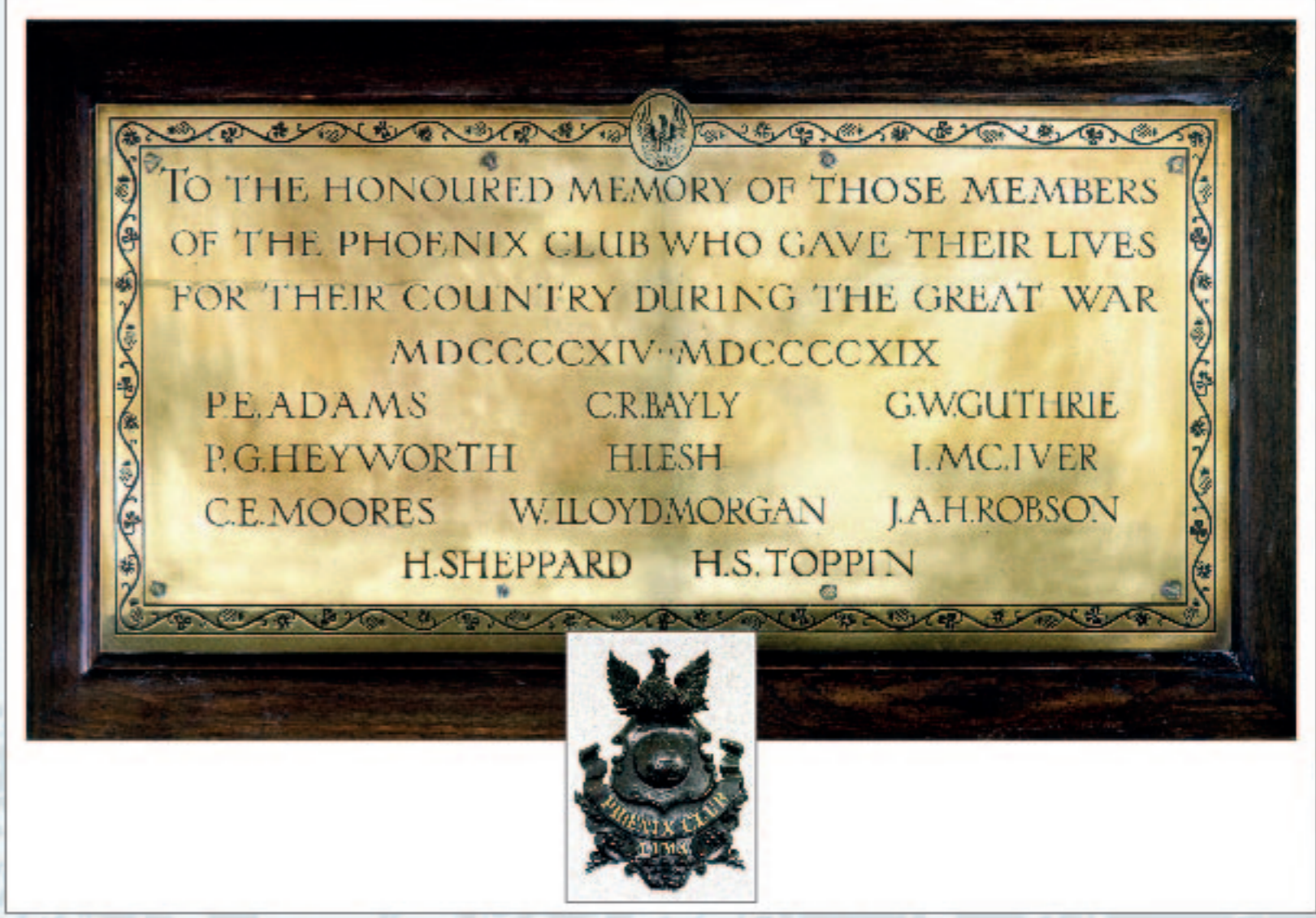
The Phoenix Club

Fundada en 1873, por ciudadanos ingleses con el consentimiento de su Majestad La Reina Victoria de Inglaterra.