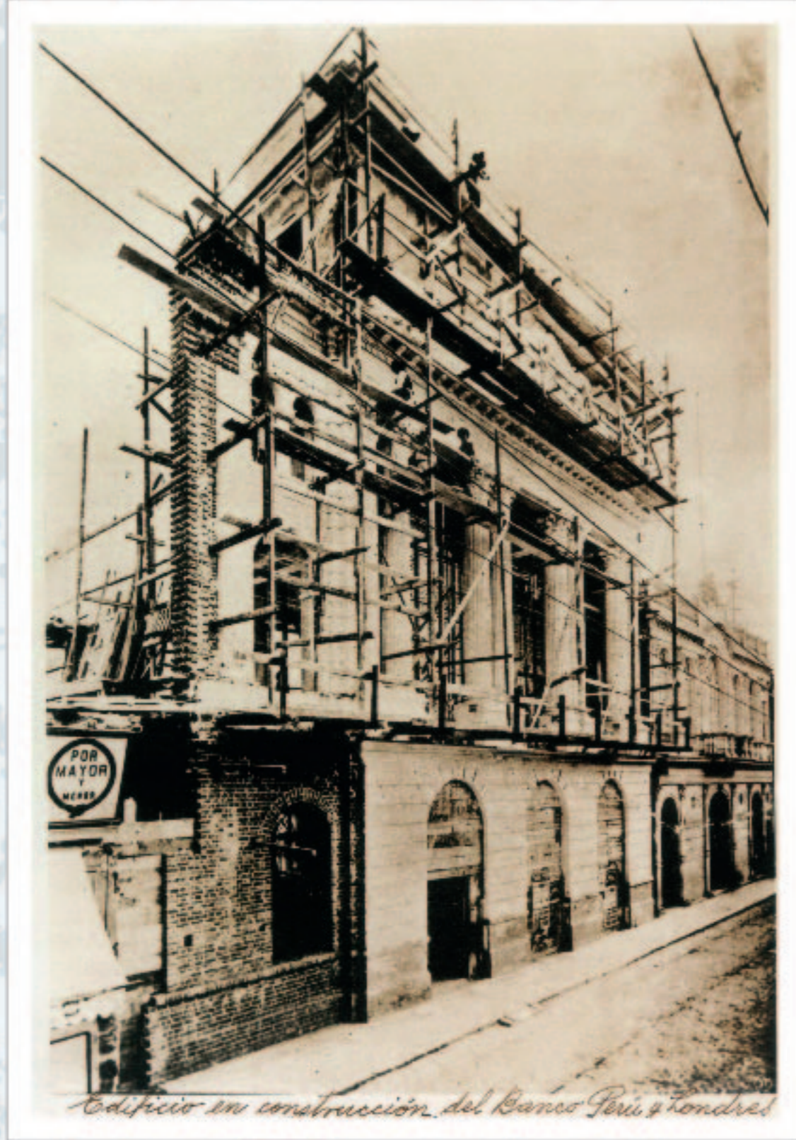
Edificio en construcción del Banco Perú y Londres Banco del Perú y Londres (antes)