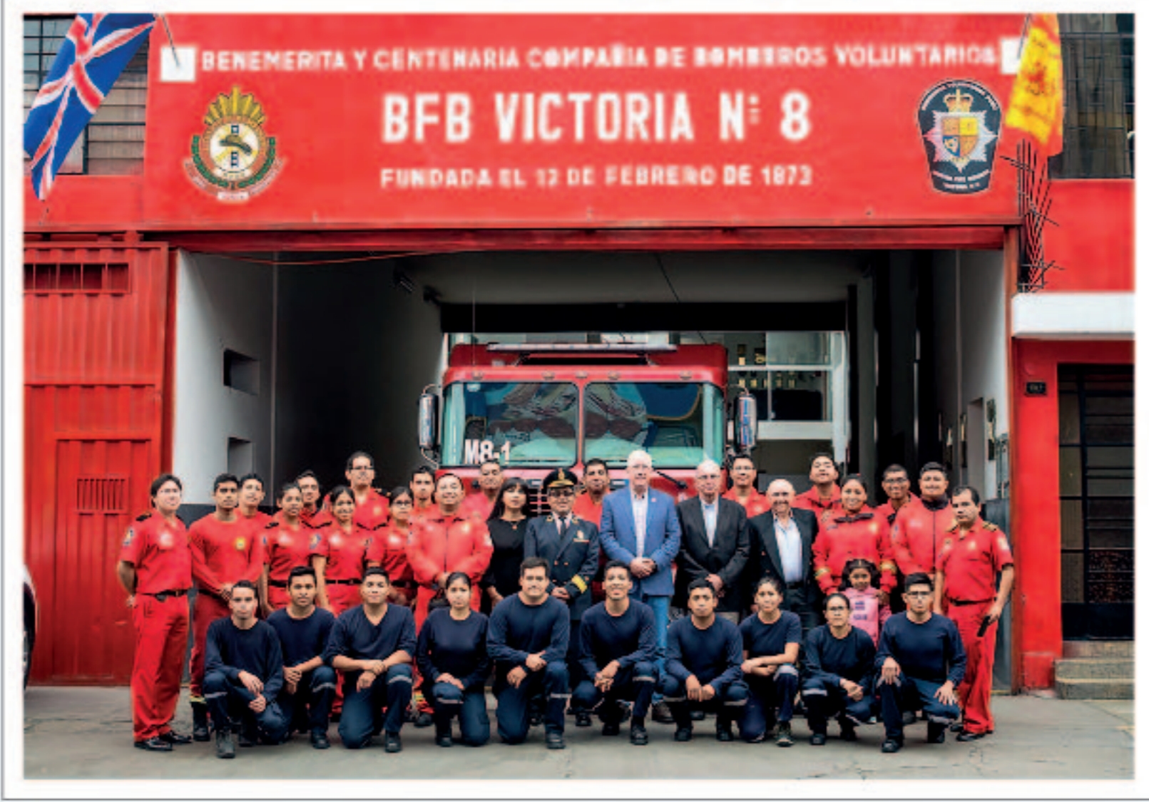
British Fire Brigade Victoria 8