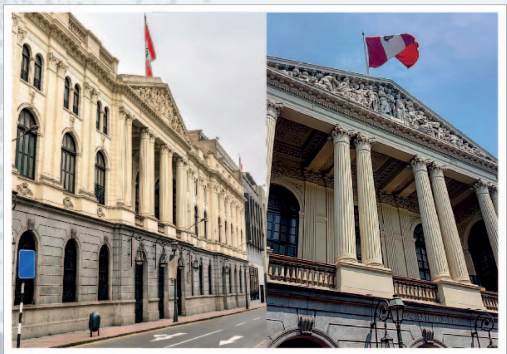
Banco del Perú y Londres (actual)