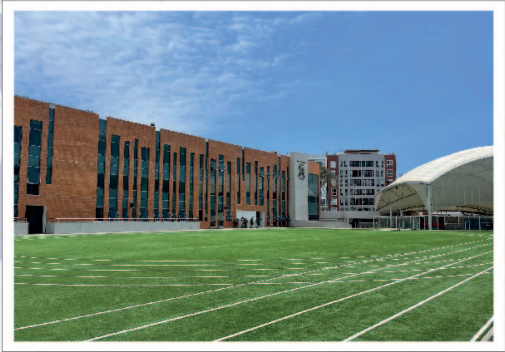
Colegio San Silvestre

El antes denominado Anglo-Peruano fue fundado el 13 de junio de 1917. Lleva el nombre del Santo Patrono de Escocia: San Andrés.