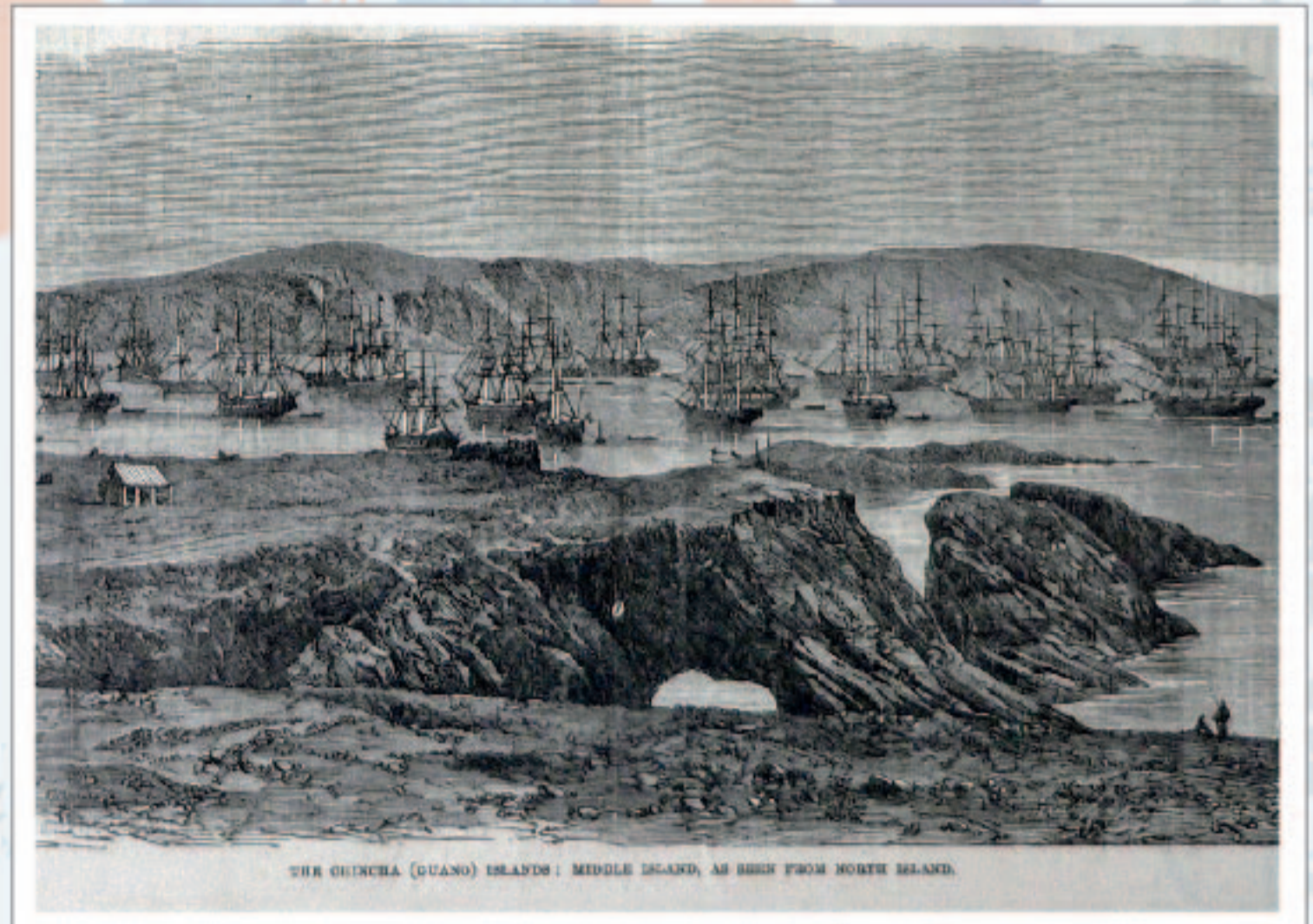
Las islas de Chincha 1863

Régimen de consignación con la Casa Comercial británica Anthony Gibbs & Sons sobre el guano peruano.