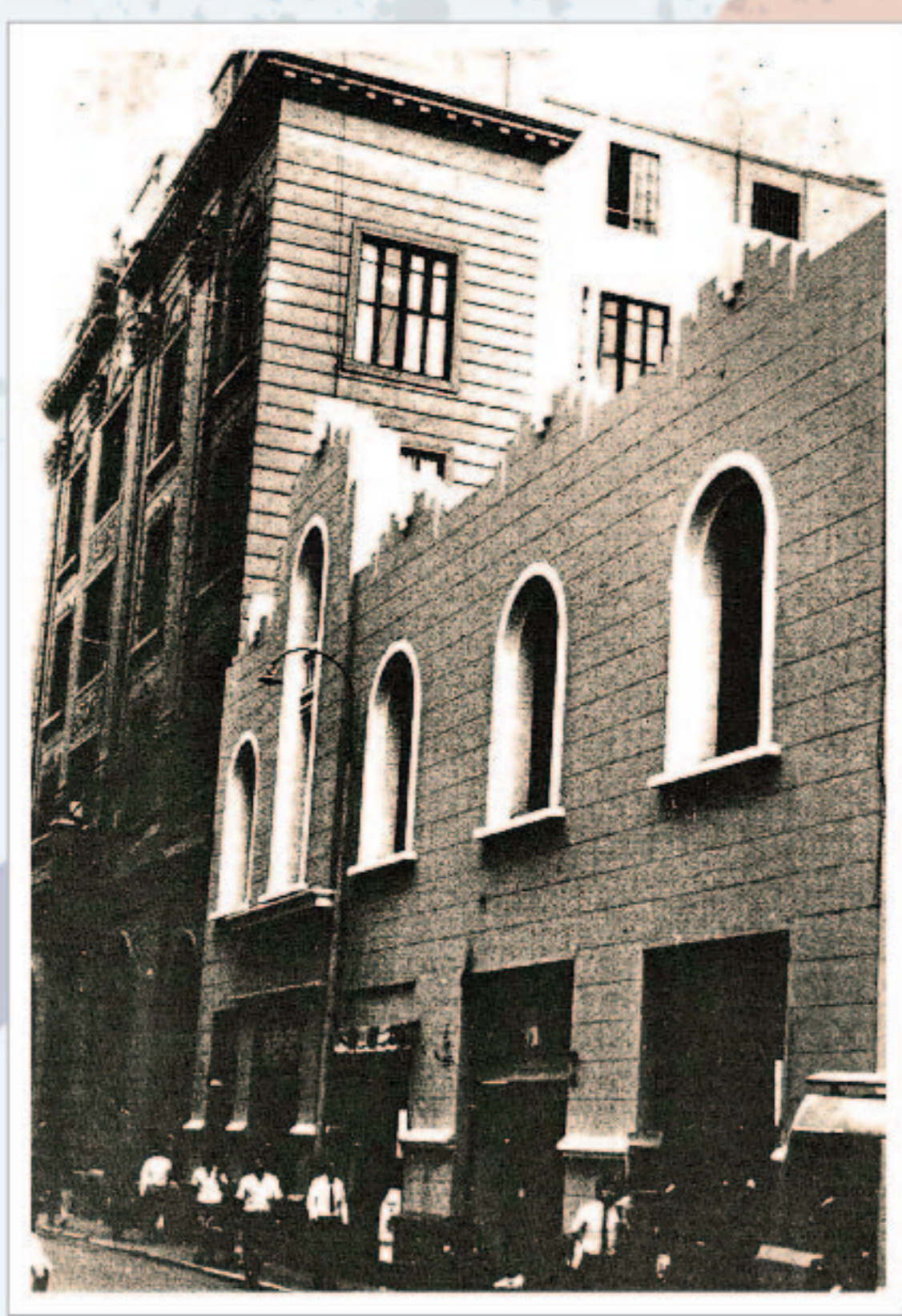
Primera sede Británico (antes)