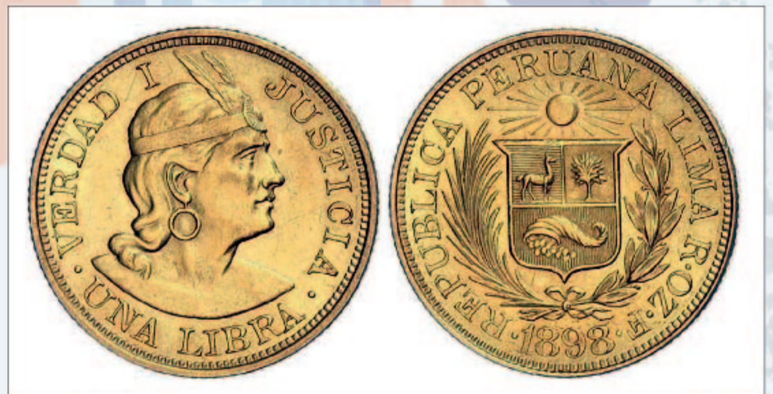
Moneda de 1 Lp acuñada en oro a partir de 1898, con la representación del inca Manco Cápac. Colección BCRP.

Entra en vigor la libra peruana. La moneda seguía el estándar de los Soberanos de Oro emitidos por Gran Bretaña.