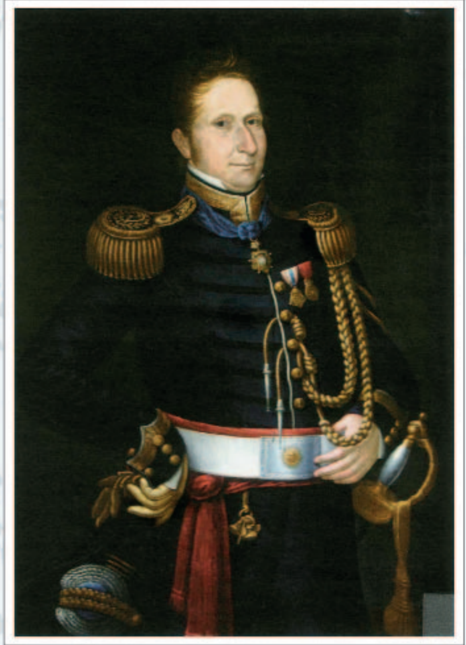
Óleo sobre tela, 1819. Embajada de Chile en Londres.