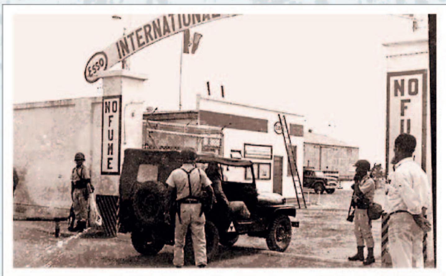
Instalaciones de la IPC, en Talara.