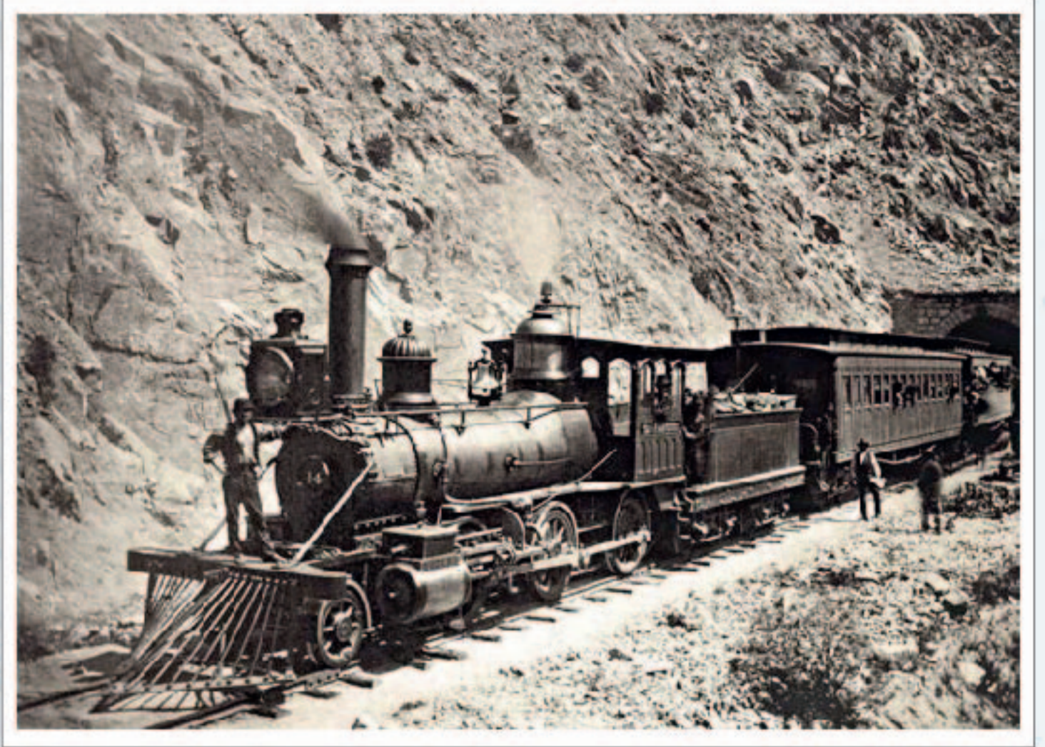
Ferrocarril peruano administrado por la Peruvian Corporation tras la firma del Contrato Grace.

Firmado por el ministro de Hacienda Ántero Aspíllaga y el conde de Donoughmore, suscrito entre el gobierno peruano y el "Comité Inglés de Tenedores de Bonos de la Deuda Externa del Perú", representado por el británico Michael Grace.