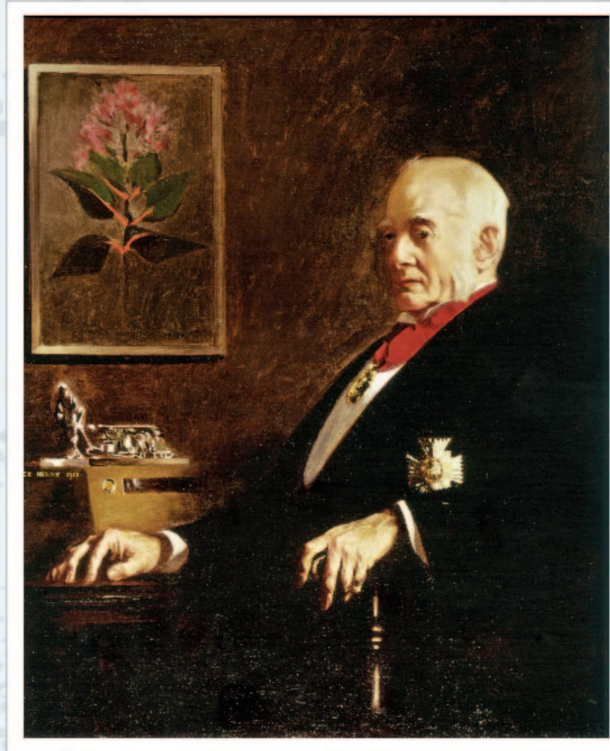
Clements Robert Markham

Emigrante británico quien se inspiró en la cultura peruana para crear la INKA KOLA.