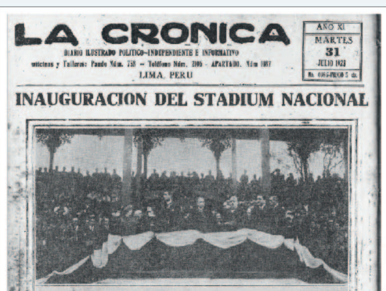
La Crónica, 1923