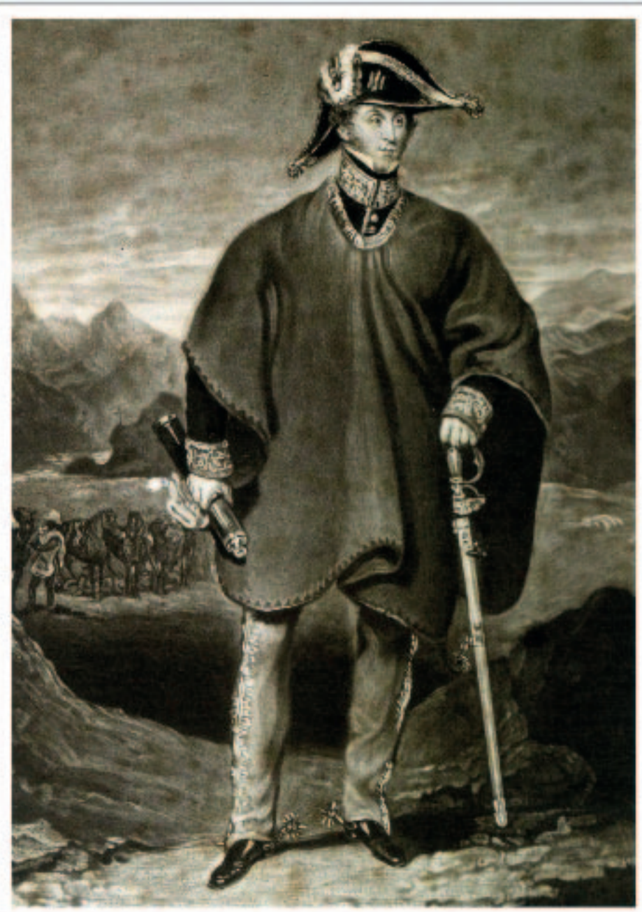
Grabado. En Memoirs of General Miller: In the Service of the Republic of Perú , 1929.

Fue nombrado Comandante General de la Marina Peruana y ofrendó su vida el 24 de noviembre de 1828, en el Combate de Guayaquil, defendiendo la libertad y soberanía de la patria que lo adoptó.