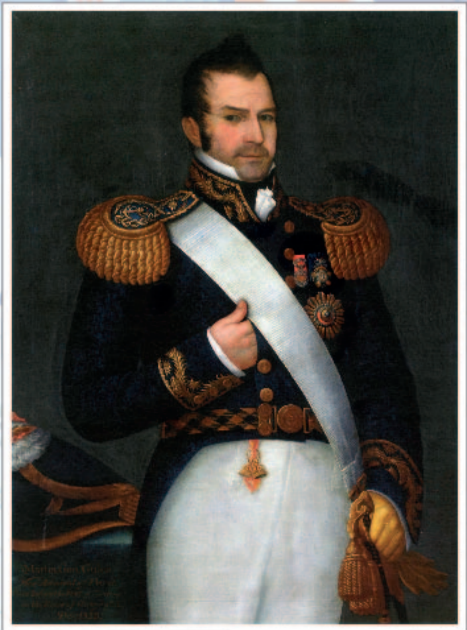
Óleo sobre tela.

Dirigió dos excursiones de reconocimiento en la costa peruana en 1819. En 1820 fue nombrado comandante de la flota naval de la Expedición Libertadora del Perú.