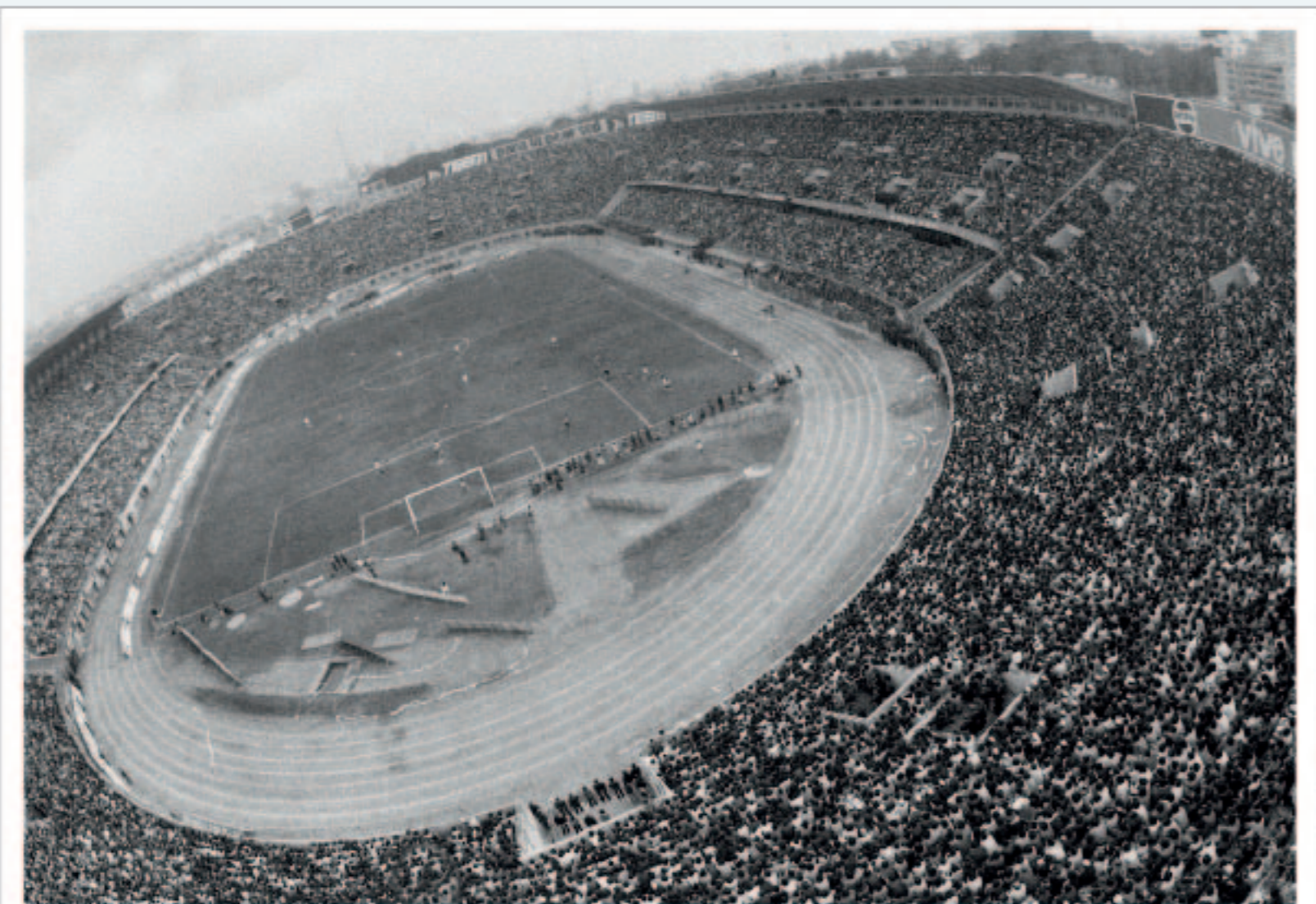
Estadio Nacional (antes)