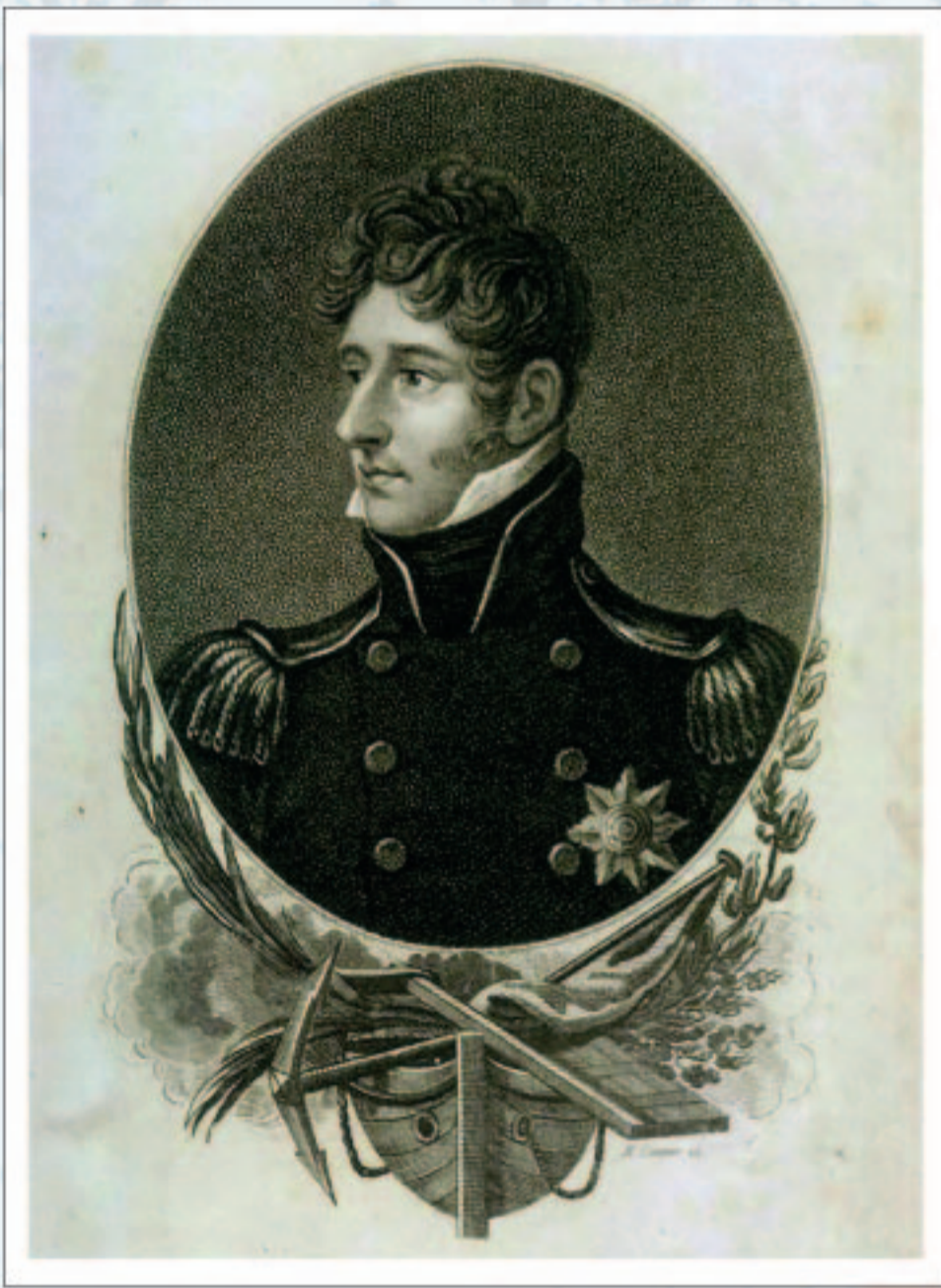
Earl of Dundonald. Grabado s. XIX.

Misión especial integrada por los ministros plenipotenciarios del Perú en la Gran Bretaña, Juan García del Río y Diego Paroissien para obtener el reconocimiento de las potencias extranjeras.