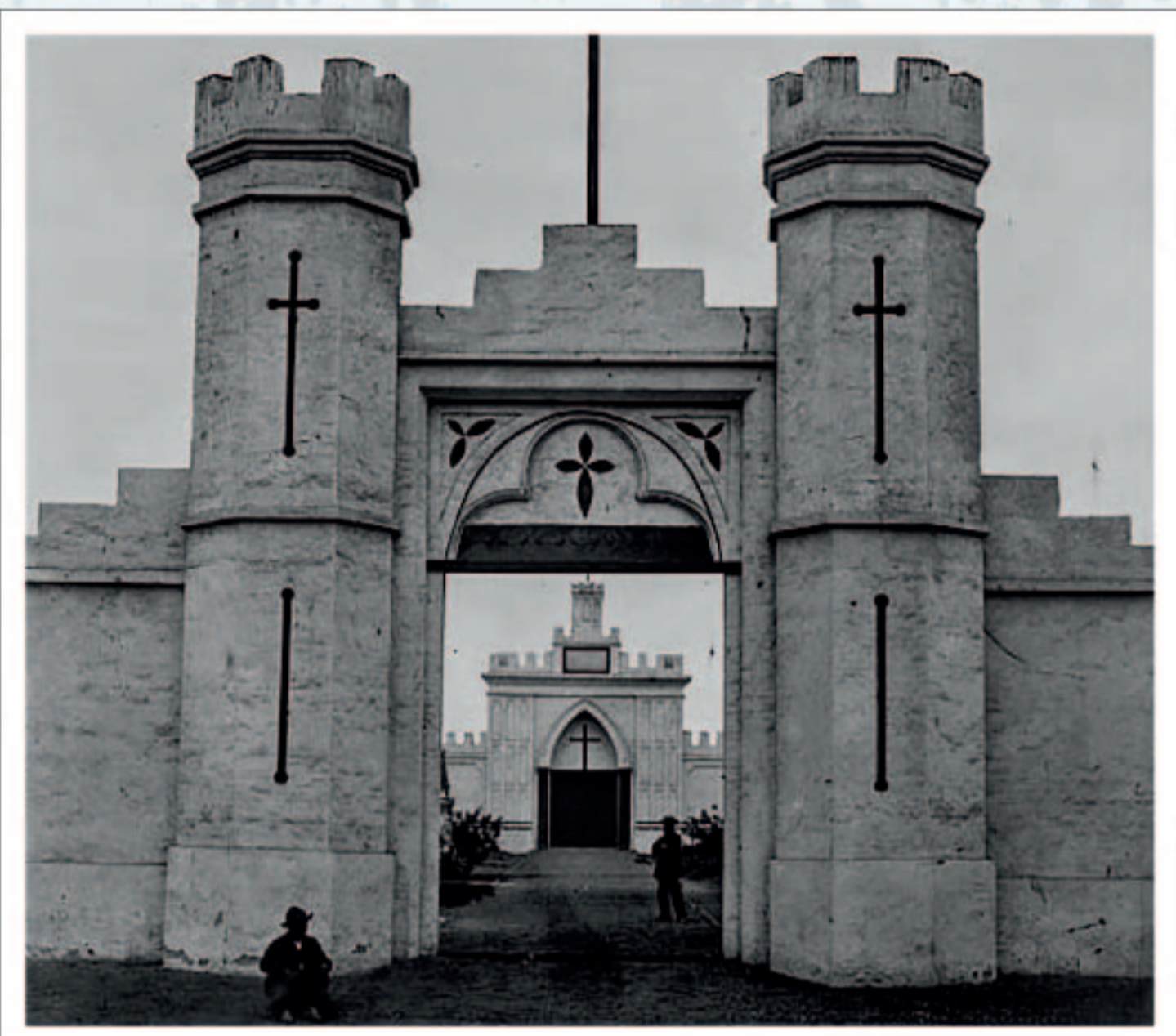
Portada de ingreso al antiguo Cementerio Británico del Callao.