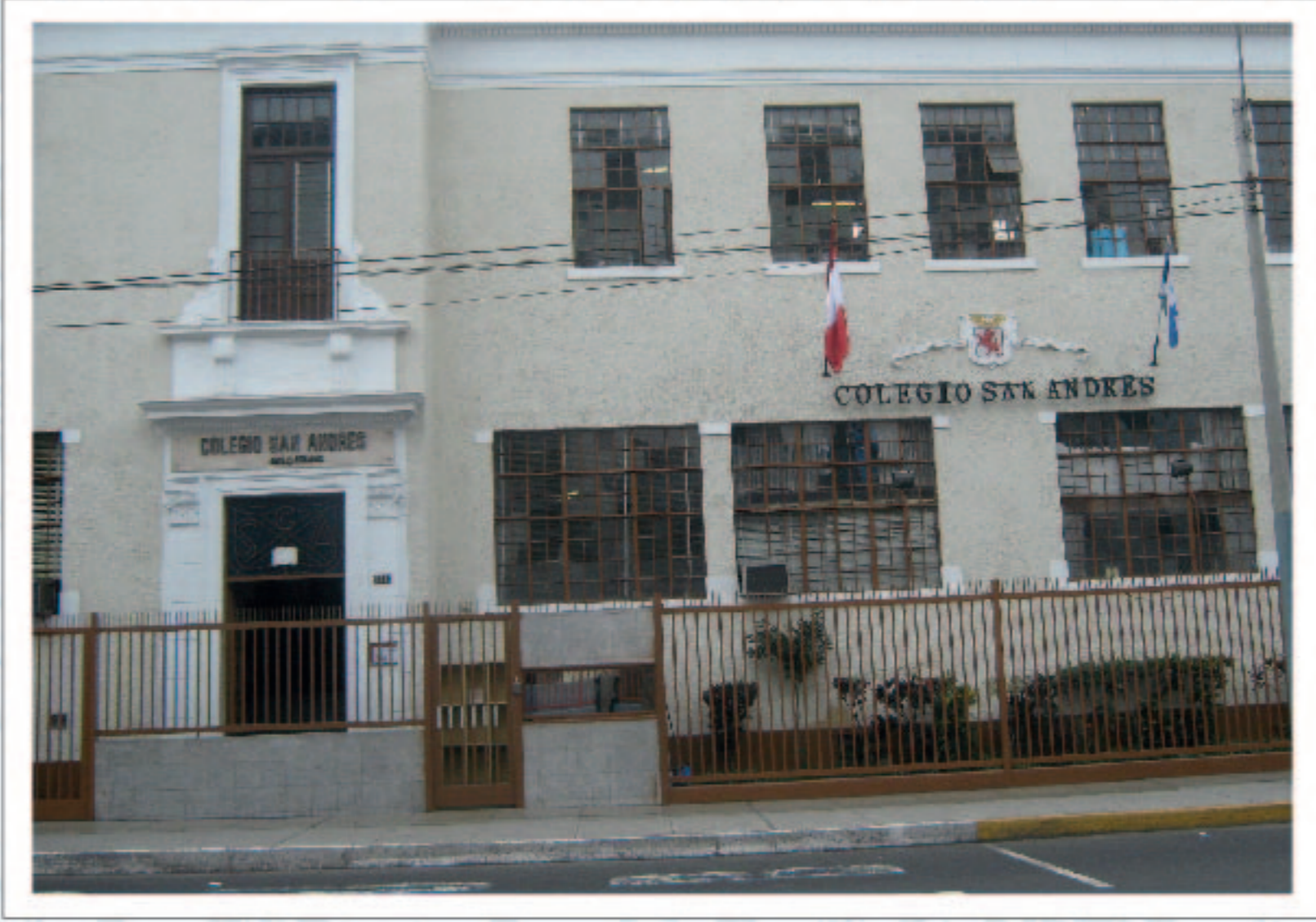
Colegio San Andrés

El antes denominado Anglo-Peruano fue fundado el 13 de junio de 1917. Lleva el nombre del Santo Patrono de Escocia: San Andrés.