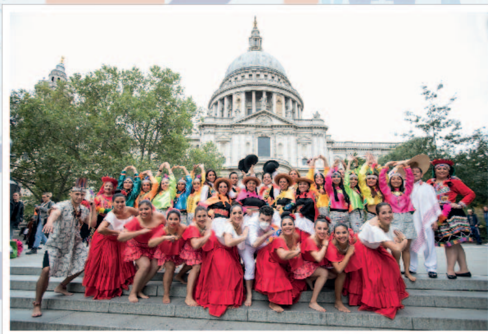
Comunidad Peruana en Inglaterra

Fundadora de la Asociación de Peruanos en Edimburgo, con la misión de llevar la bandera peruana y escocesa en alto.