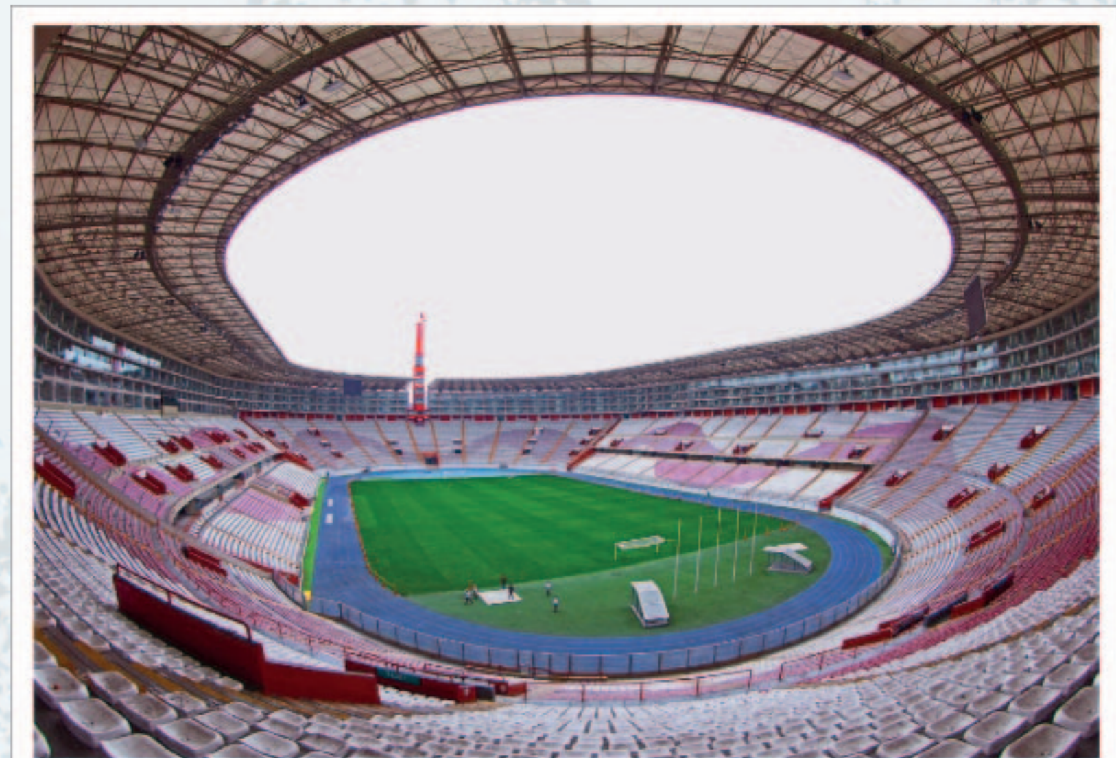
Estadio Nacional (actual)