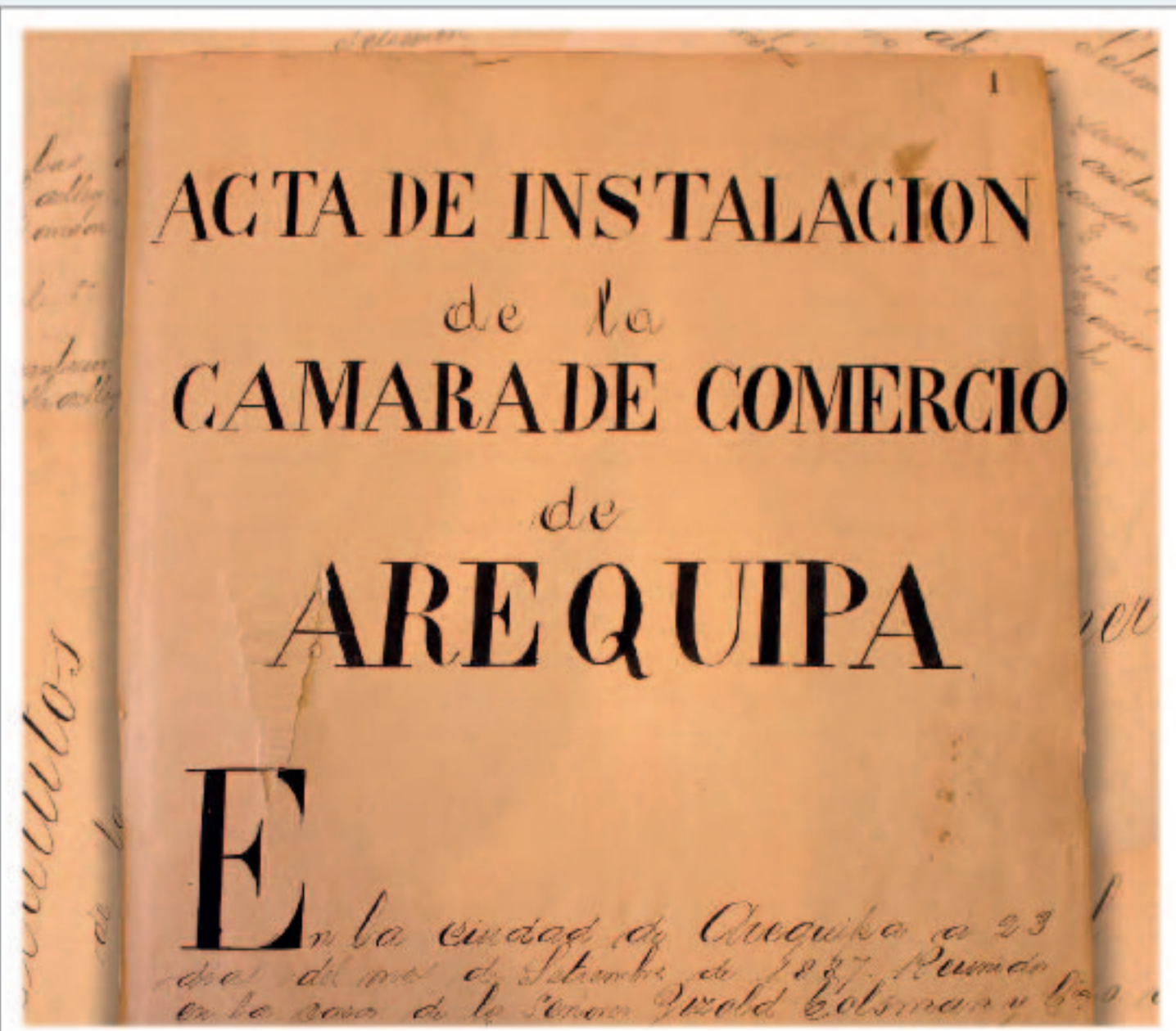
Cámara de Comercio de Arequipa, 1887.